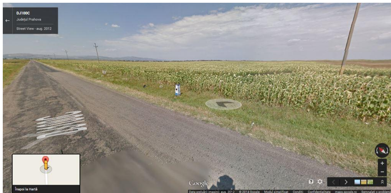
vedere spre MIZIL,terenul se afla in partea dreapta