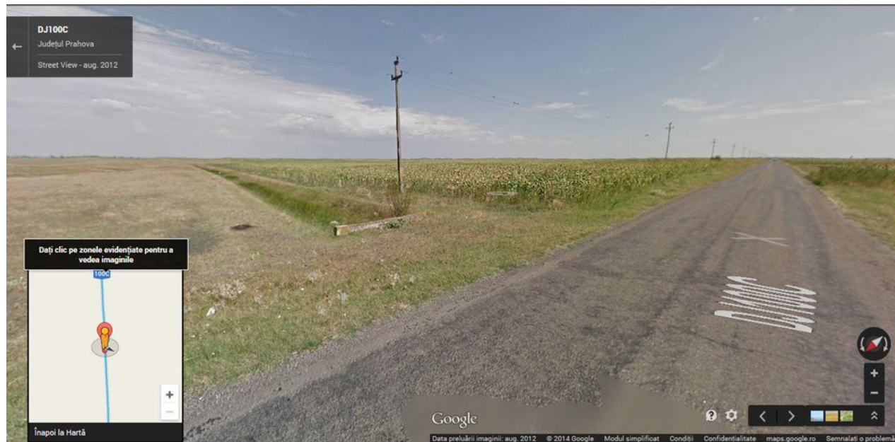
vedere dinspre MIZIL,terenul se afla in partea stanga